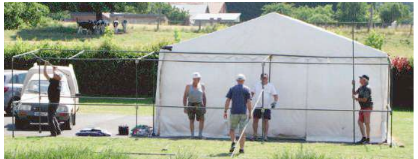
Septembre 2018: plus que 5 personnes pour monter le chapiteau...

Déjà dans le Hélot n° 25 de Septembre 2018, nous déplorions le manque de bénévoles pour organiser les animations: "...Aussi faut-il penser à préparer la relève, afin que se perpétue dans les années à venir ce bel esprit de convivialité qui malheureusement tend à disparaître dans nos petites communes qui se transforment lentement en villages dortoirs..."