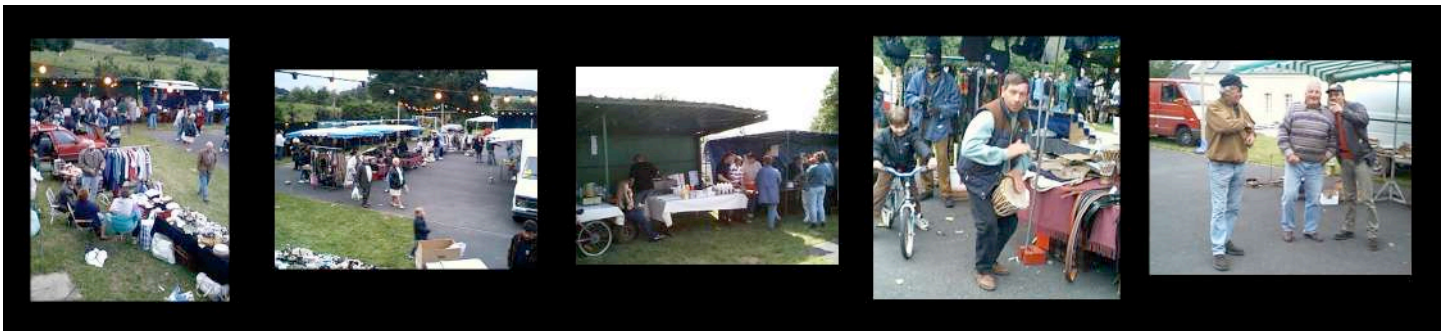
Lors d'une Fête Patronale, nous avons organisé une Brocante Nocturne qui avait connu un succès retentissant, et s'était déroulée dans une ambiance festive exceptionnelle...