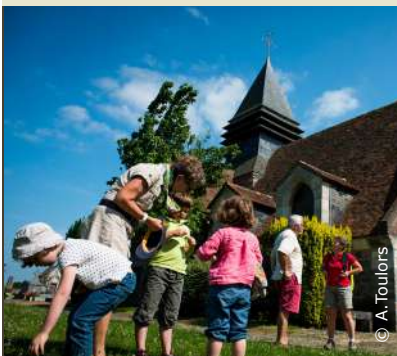
La vieille église de Caumont